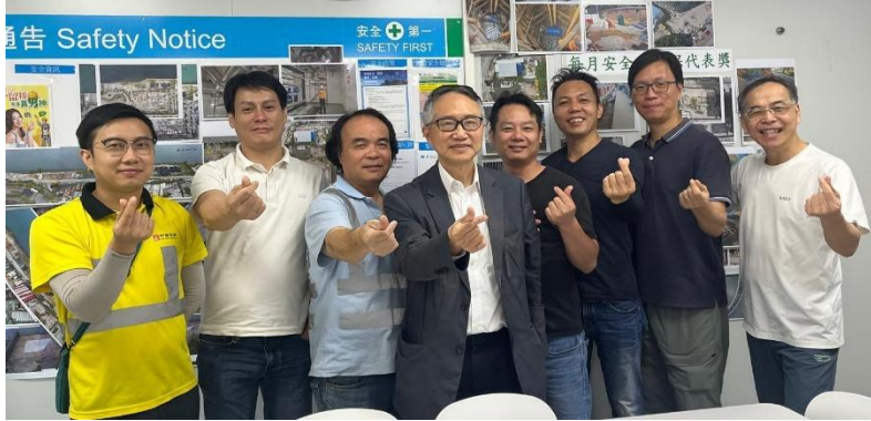
啟德地盤最後一次食住傾與電器判頭老闆和工人留影

12 位以上保華機電判頭電器工人總共出席了 8 次的中午食住傾，各位未信主的朋友都十分投入並坦誠分享個人對信仰的領受和角度，在每次的聚會各人都願意一起做謝飯祈禱也願意接受祝福他們的結束禱告。