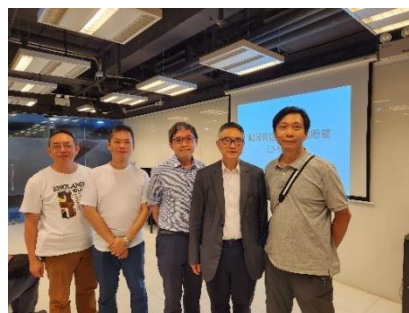
保華的舊同事出席表示支持並合影留念。